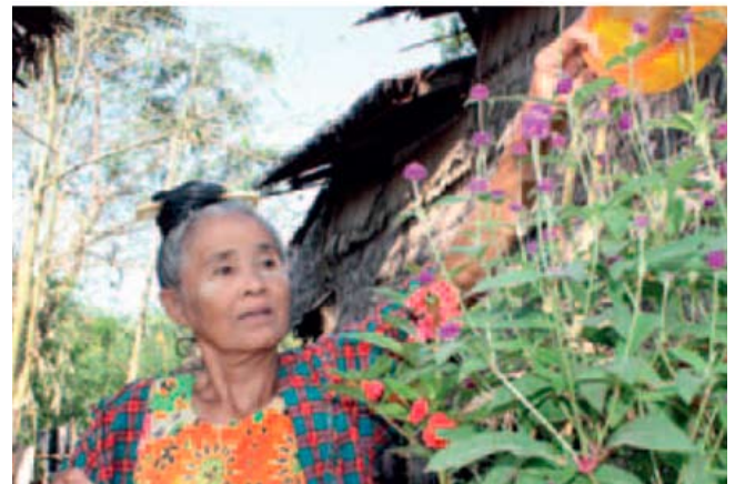
Cultivo de flores para la venta en Myanmar.

Mientras las pensiones, y particularmente las pensiones sociales, constituyen un importante fin en sí mismas, puesto que representan una enorme diferencia en el bienestar de las personas de edad, también se ha demostrado que benefician a familias