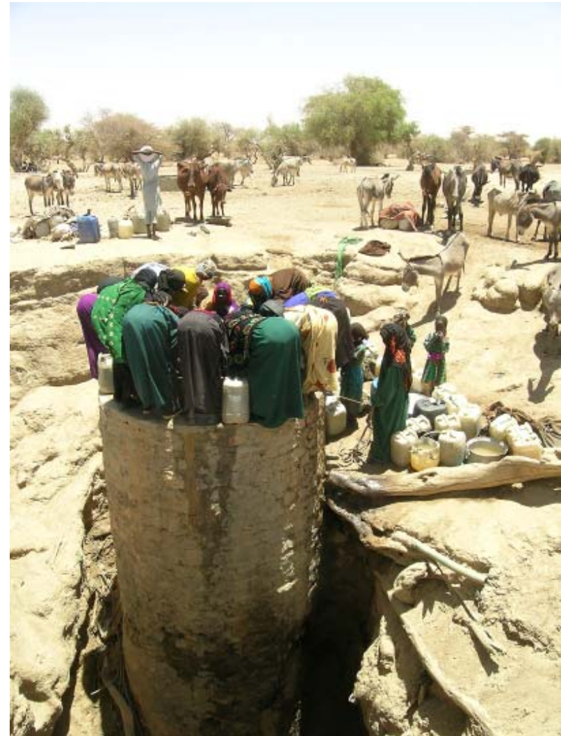
© Riccardo Polastro, ECHO/UNHCR evaluation women on a well on the border between Chad & Sudan ,