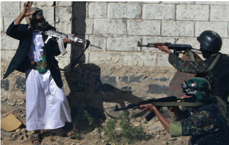
> Asistencia externa EEUU brinda asistencia al régimen de Saleh, en el marco de su guerra contra el terrorismo

Los numerosos ataques vinculados a Yemen encendieron una luz de alerta para Estados Unidos, que ahora deberá expandir aún más el alcance de su guerra contra el terrorismo. Lo que queda claro es que los grupos extremistas se las rebuscan para reconfigurarse en territorios donde reina la anarquía, y su combate se hace cada vez más difícil. “Los talibanes no necesitan Afganistán o Pakistán, pueden reconstituirse en países como Yemen y Somalia. Pero se los está enfrentando como si fuera una guerra de territorio”, concluyó Matthews. ■