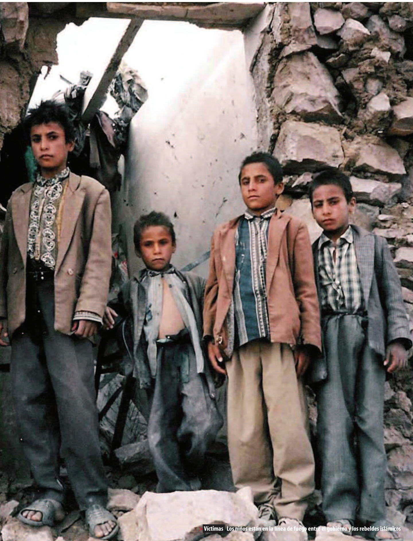
> Víctimas Los niños están en la línea de fuego entre el gobierno y los rebeldes islámicos