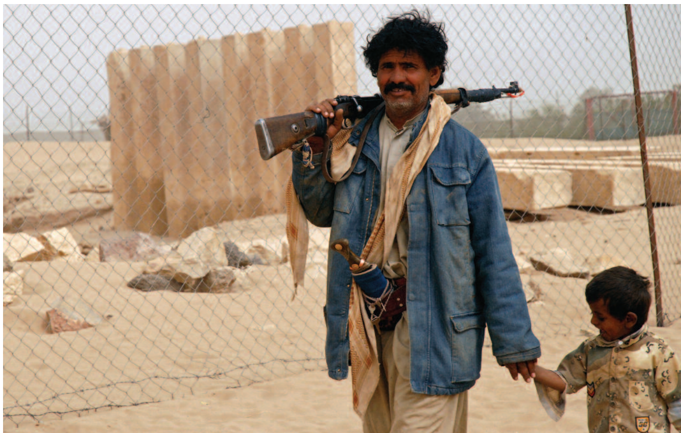
> Armados Los clanes yemeníes cuentan con sus propias milicias armadas

rismo. A pesar de que Estados Unidos no va a dejar que Yemen se caiga; no es la política correcta para enfrentar la situación”, indicó Matthews, de ICAEH. “Primero hay que dirigirse al desarrollo. Hay 20 millones de personas, mucha pobreza y los recursos petroleros se están acabando. Incluso puede ser contraproducente aliarse con un gobierno que está muy mal visto”, prosiguió.