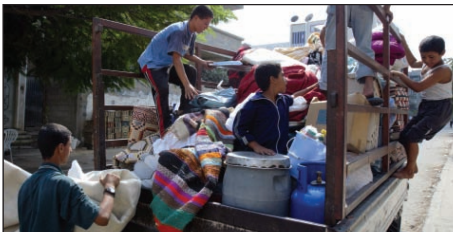
Israel está recibiendo presiones por parte de grupos pro derechos humanos de todo el mundo para que permita hacer llegar la ayuda a los palestinos.

La UNRWA alegó también que no está dentro de su mandato asumir las funciones de la ANP, y que por respeto a su soberanía tiene que contar primero con la autorización de las autoridades palestinas para responder a los llamamientos de los donantes. No se trata sólo de un problema de capacidad, sino también de legalidad y posición política. En efecto, aceptar paliar las