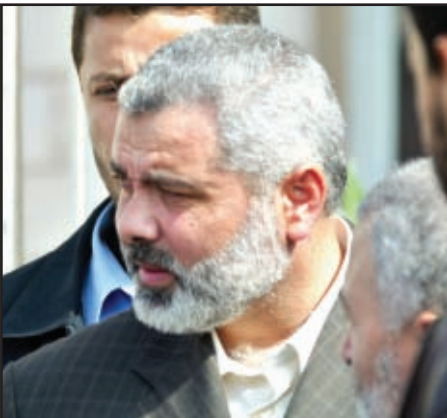
Ismail Haniya, Primer Ministro palestino.

Frente al riesgo de crear una aguda crisis social en los territorios ocupados, la UE (el mayor donante de los TOP, con una ayuda anual de 260 millones de euros que está bloqueada desde la formación en marzo del gobierno de Hamas), puso en marcha el 16 de junio un mecanismo internacional temporal que permita hacer llegar la ayuda al pueblo palestino sin pasar por las autoridades gubernamentales. Este plan de ayuda tiene tres partes: un primer programa, gestionado por el Banco Mundial, está principalmente destinado al sector de la salud. La segunda vertiente trata de consolidar el plan de ayuda de emergencia de la Comisión Europea para el suministro de bienes de primera necesidad. La tercera parte, y a la vez la más controvertida, pretende dar ayuda directa a las familias más necesitadas. Este mecanismo está abierto a otros donantes y pretende también canalizar los fondos palestinos recaudados por Israel y bloquea-