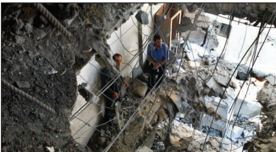
Efectos producidos por los continuos bombardeos sobre la población civil palestina.

La crisis actual ha puesto de manifiesto también la fragilidad de los avances conseguidos con los acuerdos de Oslo. El incipiente estado palestino está a merced de Israel y de sus donantes por su dependencia de los fondos internacionales.