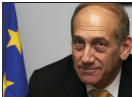
El Primer Ministro israelí, Ehud Olmert, quien cuenta con el apoyo de EE.UU. y la UE en su plan de ahogo a Hamas.

auténtica lucha por el poder, al margen de lo que los votantes palestinos han decidido y con el apoyo interesado de Israel, en su intento por recuperar a Abu Mazen, considerado un líder más maleable para escenificar la “convergencia” que Olmert tiene en mente. El último gesto de Abu Mazen, estableciendo un plazo de diez días para que