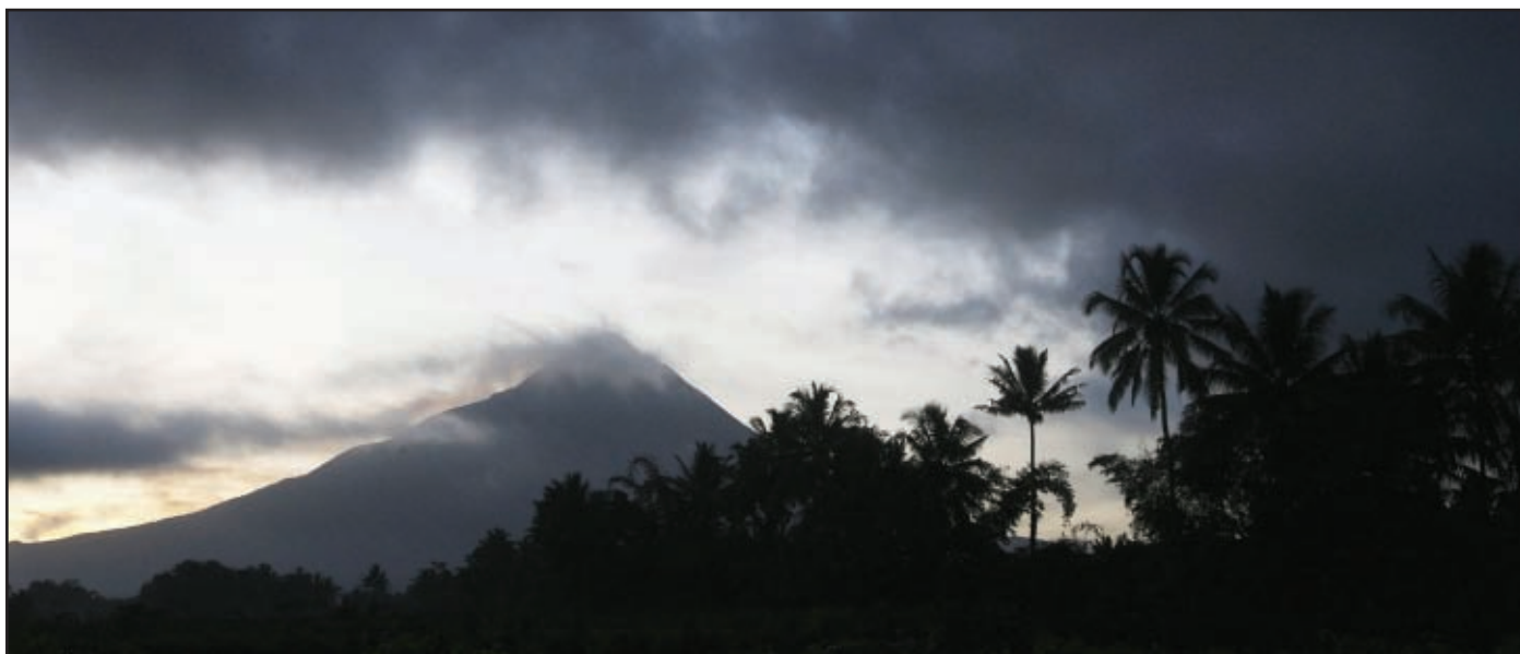
El volcán del Monte Merapi ha estado activo durante los últimos meses en la zona, lo cual ha hecho temer en muchos momentos un posible agravamiento de la crisis humanitaria.

material sanitario; y el resto del material fue destinado, bajo la coordinación de la Embajada Española en Yakarta, a la población de Tenbi, en Bantul, otra de